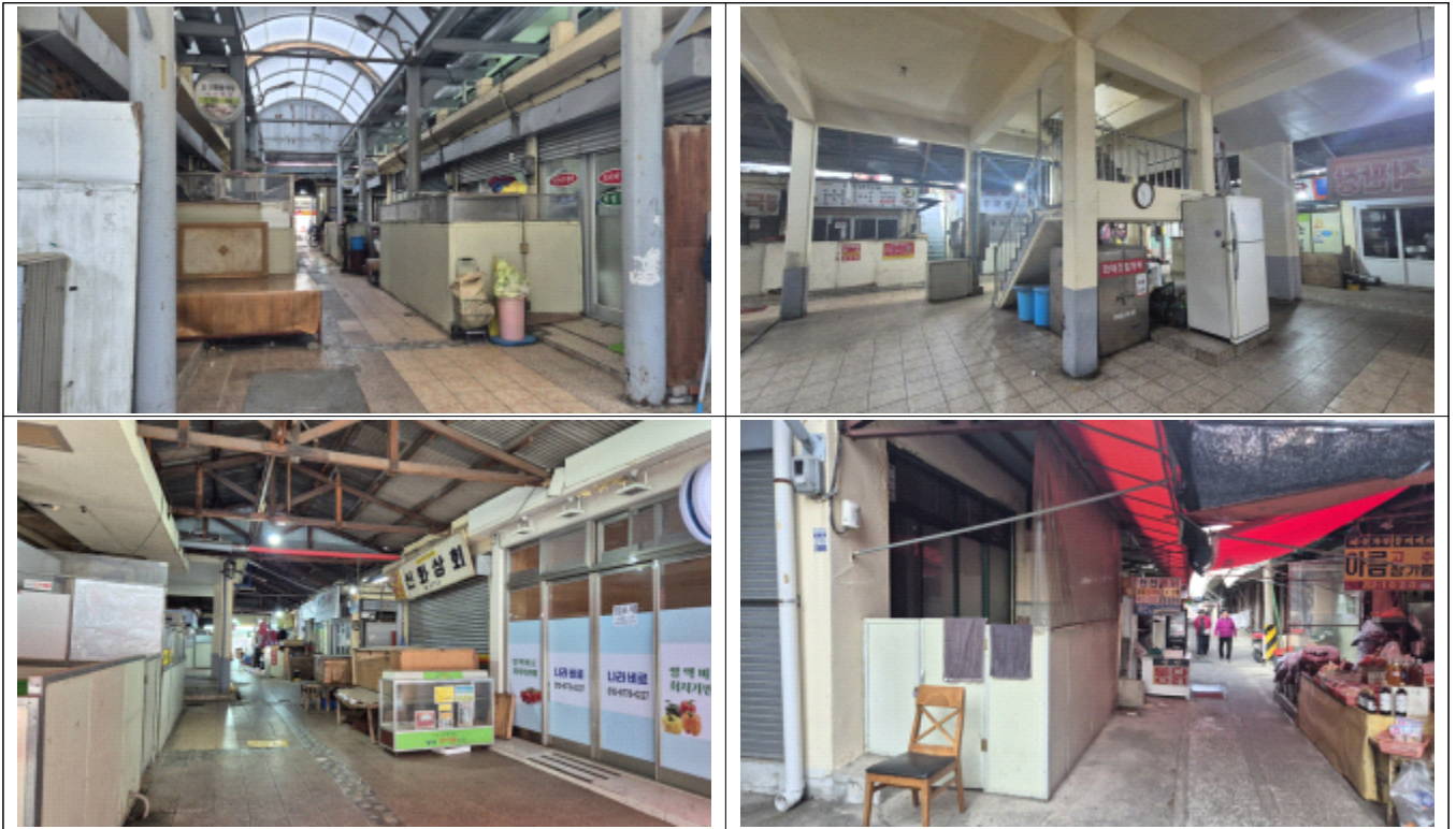
< 천전시장 현장사진 >