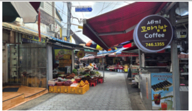
< 새서부시장 현장사진 >