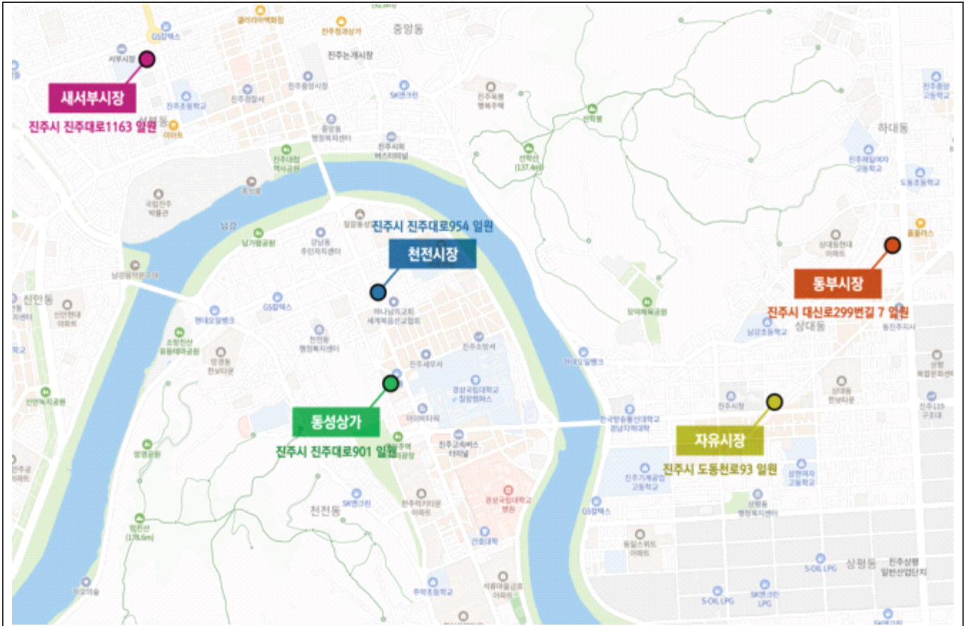
< 대상지 위치도 >