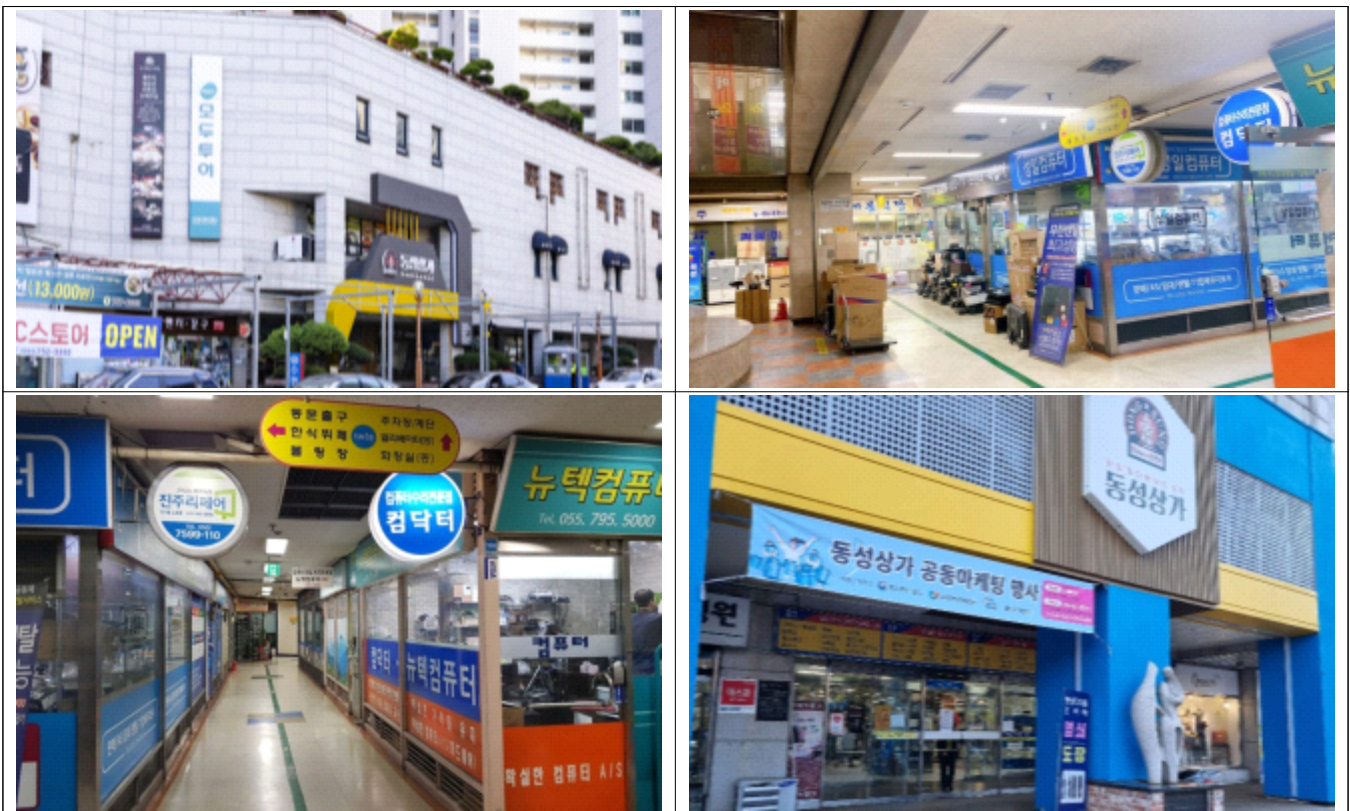
< 동성상가 현장사진 >