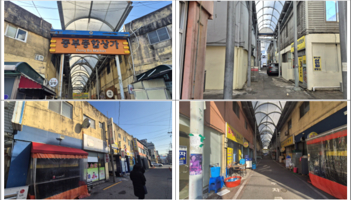
< 동부시장 현장사진 >